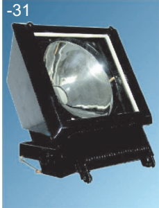
ГО-05В, ЖО-05В, РО-05В